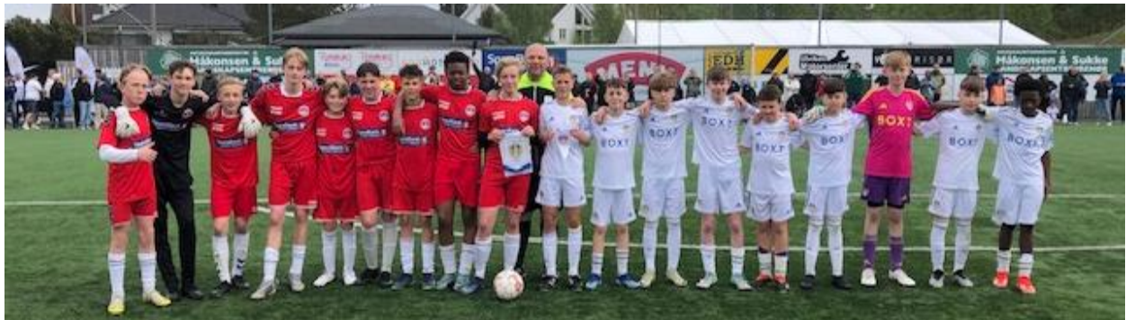
Et bilde for minneboka

Ja, slik kunne det kanskje ha sett ut i engelsk presse, men det nok var større for våre G13-gutter å ta en engelsk skalp med masse god fotballhistorie på en Kr. Himmelfartsdag, enn at det skulle få store overskrifter på fotballøya. Likevel, med lett duskregn, 12 grader i lufta og mye publikum rundt hele banen, var det duket for en ny opplevelse for våre G13-gutter. På motsatt banehalvdel stod et lag det oste fotballhistorie av; Leeds United. Klubben har mange store trofeer stående i pokalskapet Ellan Road, men likevel. Det ble en fartsfylt og litt hesblesende kamp mot de engelske gutta fra fotballbyen i nord, men gutta våre var «på» fra start og ga seg ikke før det stod 1-0 i dommerprotokollen. Når dommer blåste for full tid, var det full jubel i TFK-leiren. Dette var virkelig en vitamininnsprøyting av de Store; Seier 1-0 over en stormakt i engelsk fotball smaker godt.