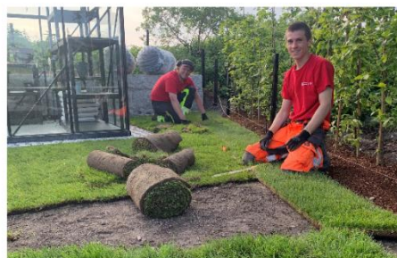
Fra idé til fiks ferdig uterom